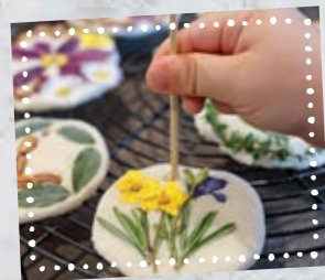
Loch nicht vergessen: So könnt ihr die Anhänger nach dem Trocknen aufhängen