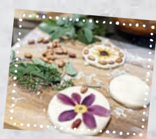
Auch Nüsse und Bohnen eignen sich zum Verzieren