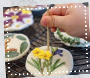
N'oubliez pas de faire un trou au bord du disque pour pouvoir le suspendre après le séchage