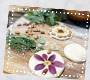
Noix et haricots sont aussi de beaux éléments déco!