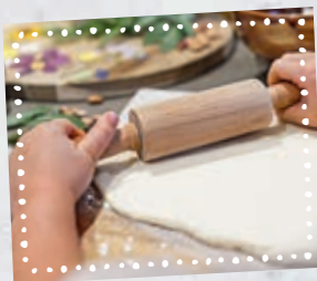
Spianare la pasta a ca. 5mm

Per decorare i dischi usate le erbe aromatiche e i fiori che trovate in giardino